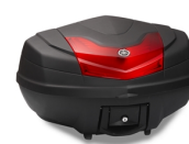
50l horní box City

For all TMAX accessories go to the website, or check your local dealer