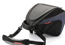
Brašna pod přístrojový panel